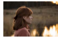
A MINHA VIDA E A TUA