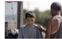
MÉDICO DE MONSTRO

Sinopse: A história tem três partes - um homem, uma mulher e sua filha. As partes estão ligeiramente conectadas e criam um círculo. O homem pega um peixe, a mulher junta uma história e a filha, de baixo da colcha, é transformada de volta ao peixe doutado. A peça explora sutilmente uma dor macia entre relacionamentos de adultos e crianças e a liberdade que uma criança