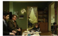
MÃE ÁGUA (MOTHER SEA)

Sinopse: O filme é uma descrição humorística da intolerância da humanidade ao outro, apesar do quanto somos todos iguais.