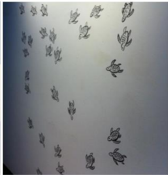
Detalhe tartarugas marinhas