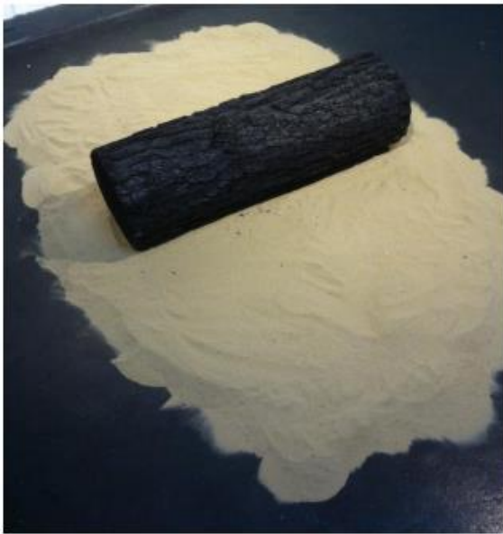
Detalhe tronco carbonizado

marinhas filhotes rumo ao mar. Em sua frente um tronco carbonizado pairava sobre areia e fazia o público refletir sobre a trajetória da vida, o que perpetua ou vira memória. A intenção era poetizar abrindo diferentes pontos de vista a partir dos componentes, sobretudo o carbono, a base da vida. Trouxe a sutil mensagem sobre a fragilidade e delicadeza do ecossistema. Em meio à beleza ameaçada, está o conceito de destruição, perda de território, aprisionamento, memória, início e fim da vida.